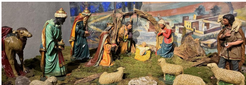
Diesjährige Weihnachtskrippe in St. Jakobus Hünfeld aus dem Bestand des Hünfelder Krippenvereins.